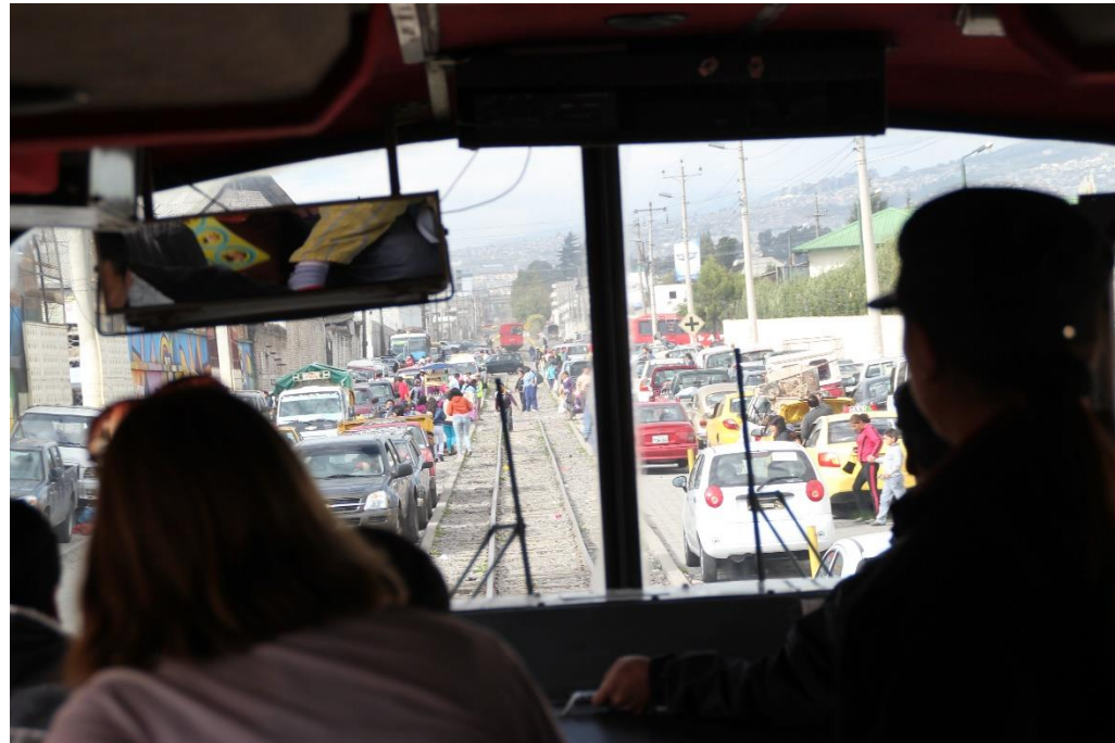
GAG Oldenburg Januar 2024